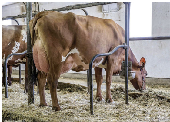
LAROC YELLOW MOCHI