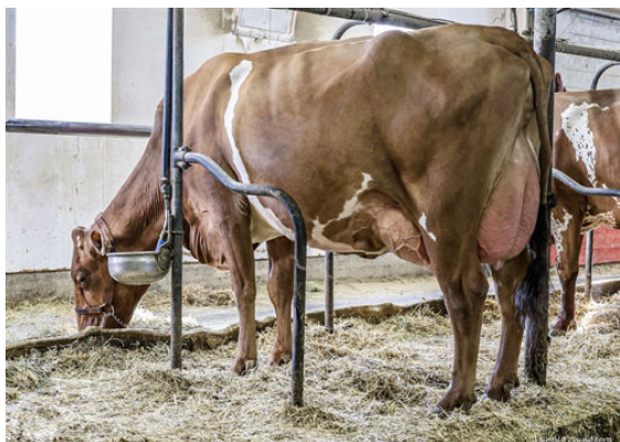
LAROC YELLOW MOCHI